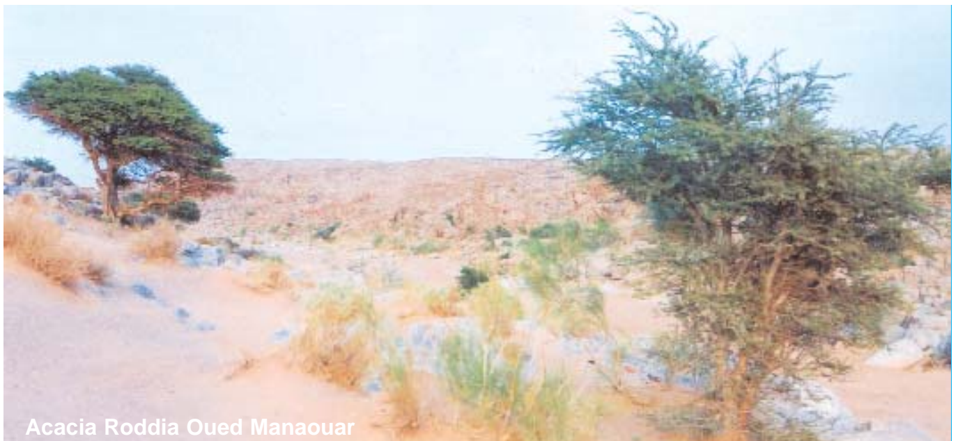
Acacia Roddia Oued Manaouar

Au Sahara : la région saharienne est quasi-désertique , il ne subsiste plus que quelques forêts reliques avec l'acacia, le tamarix, l'arganier, le cyprès du tassili et l'olivier sahari et le pistachier de l'Atlas.