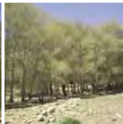
Peuplier blanc Populus alba à Aïn Aïssa