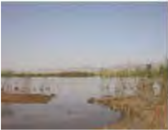
Vue de Oglet ed Daïra