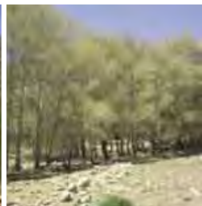
Peuplier blanc Populus alba à Aïn Aïssa