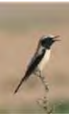
Traquet du désert

des agglomérations, ou alors au Faucon crécerelle ( Falco tinnunculus ), dans les endroits plus reculés. Le Corbeau brun remplace le Grand corbeau au-delà d'une certaine ligne passant par Mécheria-Tiaret. Sa présence coïncide en général avec les conditions écologiques caractérisant les régions arides. Dans les lits d'oueds caillouteux, on rencontre l'Oedicnème criard ( Burhinus oedicephalus ), un oiseau très discret et qui ne s'envole que quand on s'approche de lui. Les milieux plats sont affectionnés par les gangas, le plus abondant dans ces contrées étant le ganga unibande ( Pterocles orientalis ) et plus au nord, là où les cultures céréalières sont fréquentes, le Ganga cata ( Pterocles alcata ) prend le relais. Plus sahariens sont le Ganga tacheté ( Pterocles senegallus ) et le Ganga couronné ( Pterocles coronatus ). Les milieux