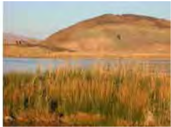
Vue de Aïn Ouarka

s'y déversent, riches en matière organique, elles favorisent alors la pullulation de larves d'invertébrés (odonates, diptères ...). Ce site accueille principalement la population de Tadone casarca qui niche dans les alentours dont les oiseaux viennent se nourrir de diverses larves et les gangas qui viennent y boire quand c'est le seul point d'eau disponible. Au contraire de cette sebkha, Oglat Edaïra contient de l'eau qui varie du saumâtre au doux au grès des précipitations. Il arrive aussi que cette dernière soit à sec à certaines périodes de certaines années. Toutes ces conditions influent alors sur ses qualités écologiques. Ce site étant situé sur la voie des migrations l'ouest, il accueille de nombreuses espèces aux deux passages migratoires mais il héberge surtout une population de Tadorne casarca (presque sédentaire) qui niche dans les cavités rocheuses non loin de la zone humide. Même si jusqu'à présent aucune observation ne confirme leur présence, les espèces suivantes : Erismature à tête blanche Oxyura leucocephala , Sarcelle marbrée Marmaronetta angustirostris et Fuligule nyroca Aythya nyroca , toutes les trois figurant sur la liste UICN des espèces en danger, sont susceptibles d'être rencontrées sur ce site quand il est rempli d'eau et pourvu de végétation. En période de migration et en hivernage, d'autres oiseaux peuvent y être observés :