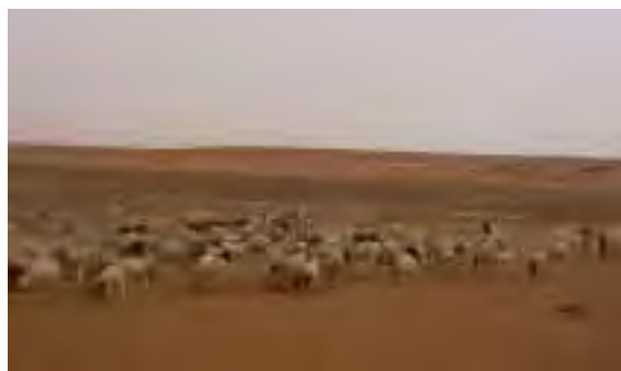
Disparition de la végétation et processus d'érosion ayant entraînés la désertification dans la région de Oglat Ed Daïra.

À terme, la dégradation de la végétation sur des terres utilisées comme parcours anéanti le potentiel agricole et pastoral.