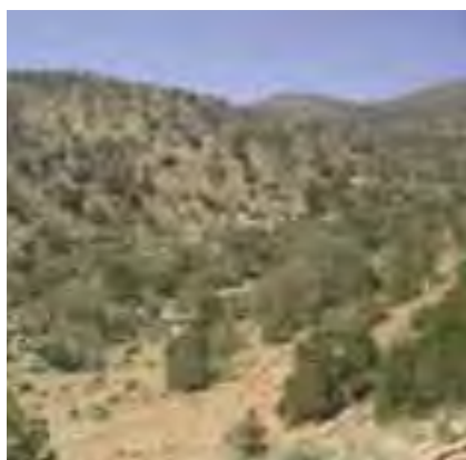
Paysage de Djebel Aïssa

contrées communément en région tellienne. Les espèces d'oiseaux suivants y sont nicheuses : Mésange bleue ( Parus caeruleus ), Gobemouche gris ( Muscicapa striata ), Pinson des arbres ( Fringilla coelebs ), Geai des chênes ( Garulus glandarius ), Petit duc Scops ou Hibou petit duc ( Otus scops ), Piegriche à tête rousse ( Lanius meridionalis ), Rougequeue à front blanc ( Phenicurus phenicurus ), Chardonneret élégant ( Carduelis carduelis ), Linotte mélodieuse ( Carduelis cannabina ), Fauvette de l'Atlas ( Sylvia deserticola ), Hypolaïs polyglotte ( Hippolais polyglotta ), Merle noir ( Turdus merula ), Merle ou Monticole bleue ( Monticola solitarius ), Tourterelle des bois ( Streptopelia turtur ), Buse féroce ( Buteo rufinus ), Aigle de Bonelli ( Hieraetus fasciatus ), Aigle botté ( Hieraetus pennatus ), Faucon lanier ( Falco biarmicus ), Huppe fasciée ( Upupa epops ), Roselin githagine ( Bucanetes githagineus ), Bruant striolé ( Emberiza striolata ), Pigeon ramier ( Columba palombus ). Ce cortège avifaunistique témoigne d'une prospérité forestière dans tous les Djebels qui forment les Monts des Ksours, eux même faisant partie de l'Atlas saharien.