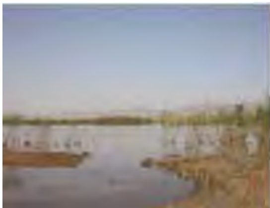
Vue de Oglet ed Daïra